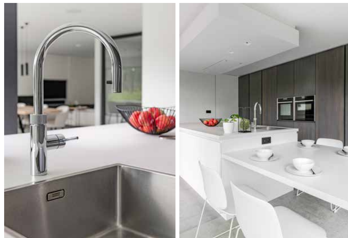
De warmte van de grijze eik staat in knap contrast met het diepmatte wit van het Fenix antivingerafdruklaminaat.